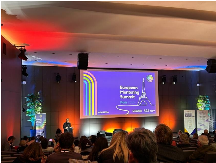
Discours de Christophe Paris, président du Collectif Mentorat, lors de la cérémonie de clôture du Sommet

100% Handinamique était présent au sommet notamment pour l'animation d'un atelier le 26 au matin sur la pair-aidance dans le mentorat !