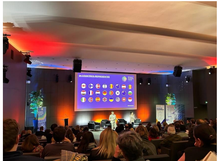
Des représentant-es de vingt-quatre pays du monde entier étaient présents sur les trois jours du Sommet