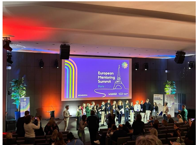
Cérémonie de clôture du Sommet